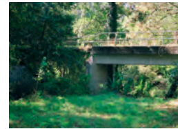
Ponte de Cardezo.