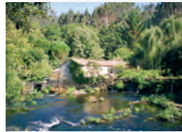
O muíño da Saimía. Aquí se transformaron os cereais en fariña.