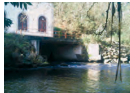
Minicentral Hidroeléctrica Corcoesto.