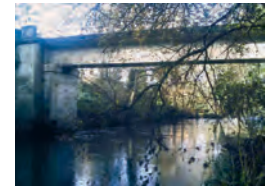
Ponte de Xavarido.