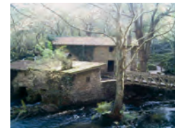
Refuxios e muíños de Verdes.