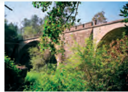
Ponte de Caldas.