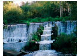
Central Hidroeléctrica do Anllóns.