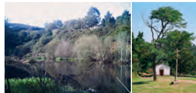
Capela de Santa Mariña.