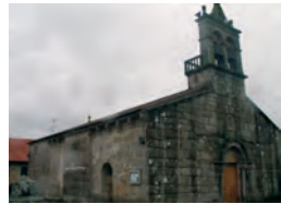
San Fiz de Anllóns, as súas campás lembran a poesía de Pondal.