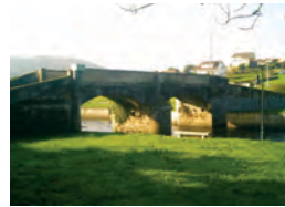
Ponte da Garga.